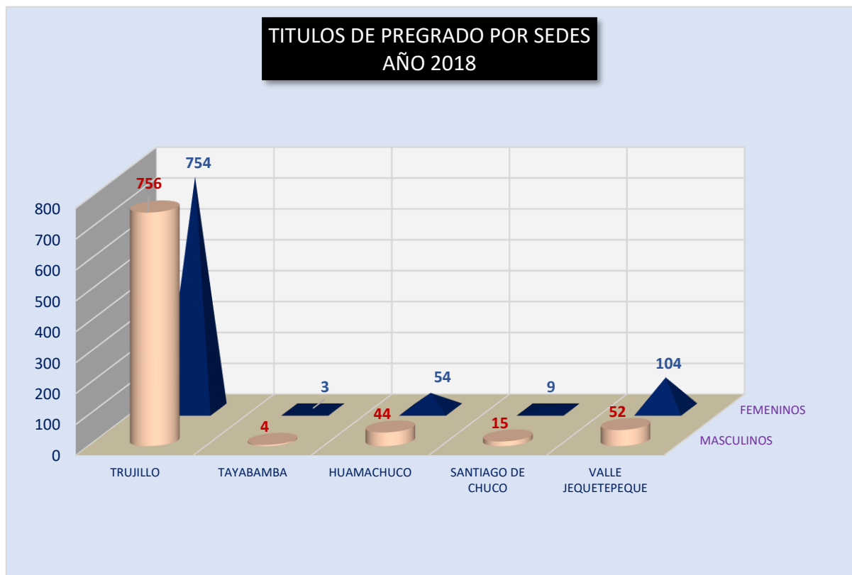
GRÁFICO N° 02 TITULADOS DE PREGRADO POR SEDE DE LA UNT AÑO 2018

Elaborado por: Sección de Informática y Estadística