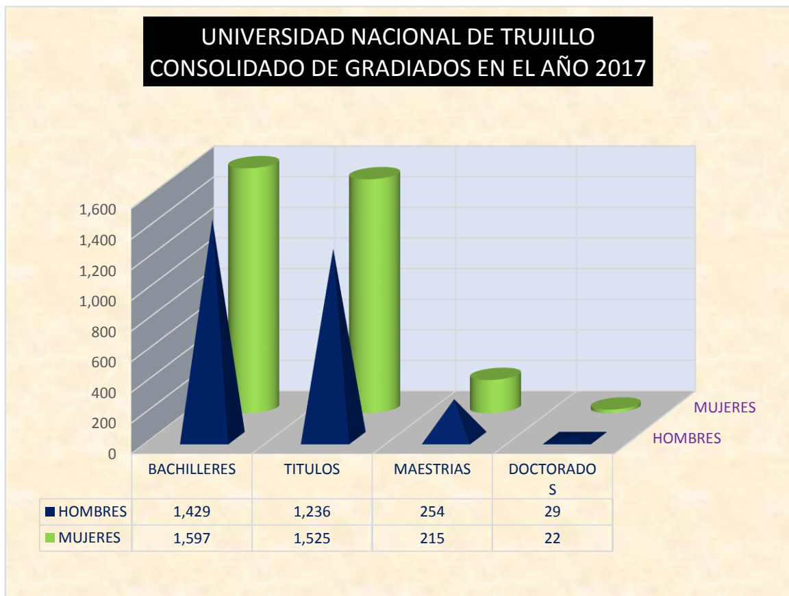
GRÁFICO N° 03 Consolidado del Año 2017 por Genero

Elaborado por: Sección de Informática y Estadística – Dirección de Registro Técnico