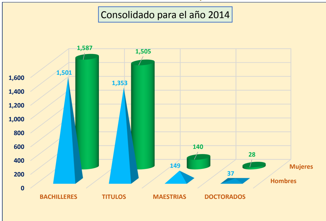
GRÁFICO N° 03 Consolidado del Año 2014 por Sexo

Elaborado por la Oficina de Registro Técnico – Sección de Informática