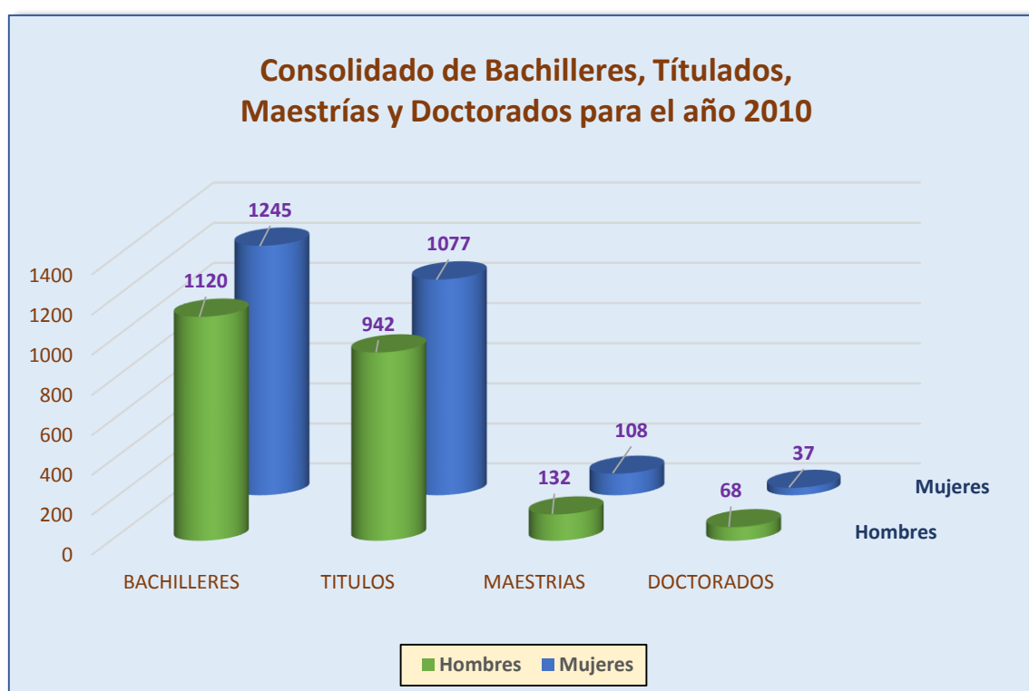
GRÁFICO N° 03 Consolidado del Año 2010 por Sexo

Elaborado por la Oficina de Registro Técnico – Sección de Informática